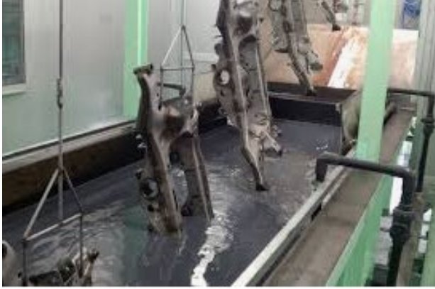
でんちゃくとそう 電着塗装