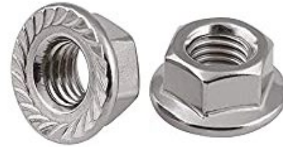
ふらんじなっと フランジナット