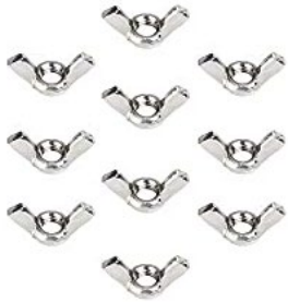
ちょうなっと 蝶ナット