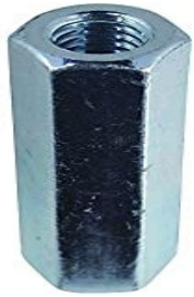
たかなっと 高ナット