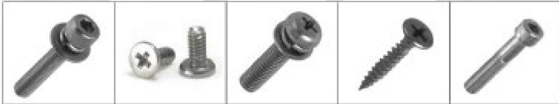
ろっかくあなつきくみこみねじ 六角穴付組込ネジ