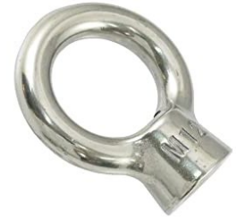
あいなっと アイナット