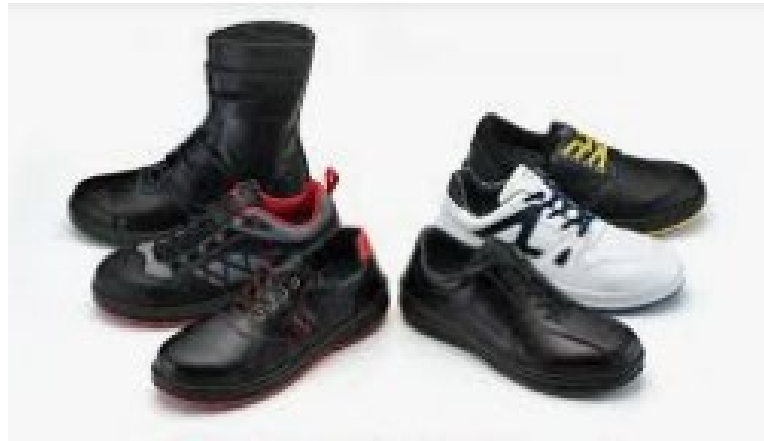
あんぜんぐつ 安全靴