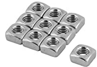
しかくなっと 四角ナット