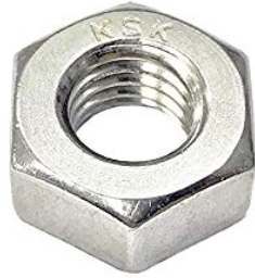
ろっかくなっと 六角ナット