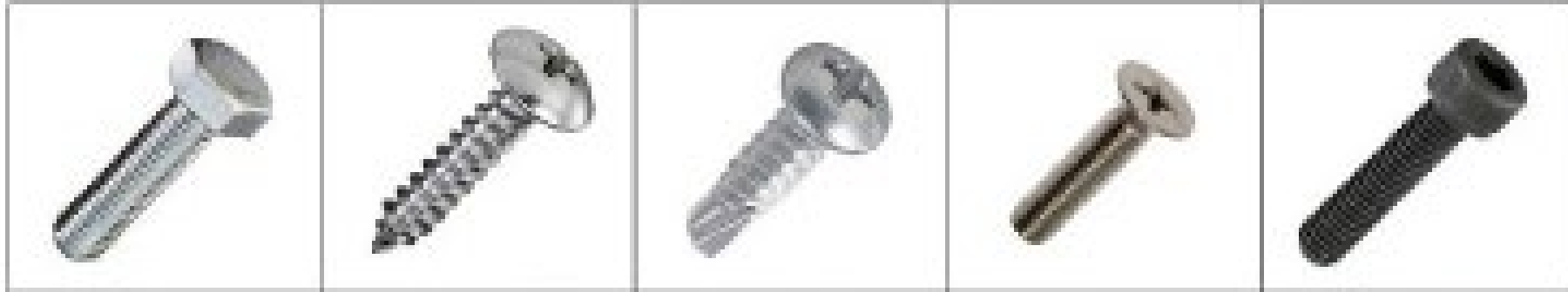
ろっかくぼると 六角ボルト