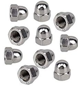
ろっかくふくろなっと 六角袋ナット