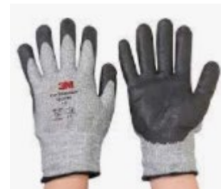
せつそうてぶくろ 切創手袋

えいり あつか ばあい 鋭利なものを扱う場合、 けが ふせ ちやくよう 怪我を防ぐために着用 する