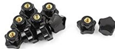
のぶなっと ノブナット