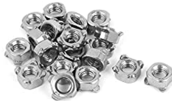
ようせつなっと 溶接ナット