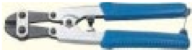
ぴあのせんくりっぱー ピアノ線クリッパー