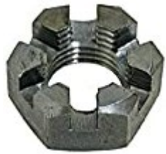
みぞつきなっと 溝付ナット