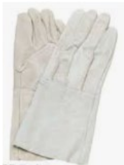
かわてぶくろ 皮手袋

ぎゅうがわ 牛皮でできている。 ようせつ やけど ちよくせつ ぶ 溶接による火傷や直接接触れる けが ふせ ことによる怪我を防ぐ