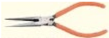
らじおべんち ラジオペンチ