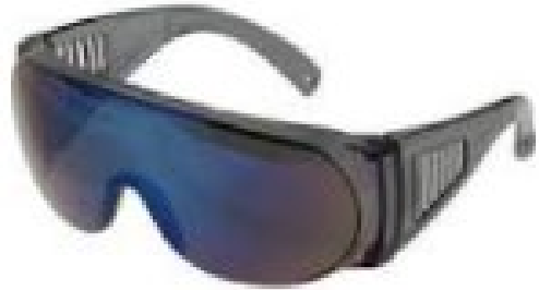
ほごめがね 保護メガネ